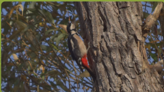
♀ adulte - 24cm - 83g

Résistance aux chocs · Bâtisseur · individualiste